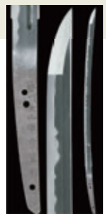
広島県重要文化財 「刀 銘 藝州大山住宗重作 永禄十一年八月吉日」(個人蔵)

問い合わせ／STORY事務局 TEL082-236-2244 (平日9:30～17:30)